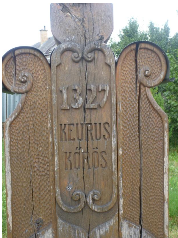
Pamätný stĺp v obci Kružná