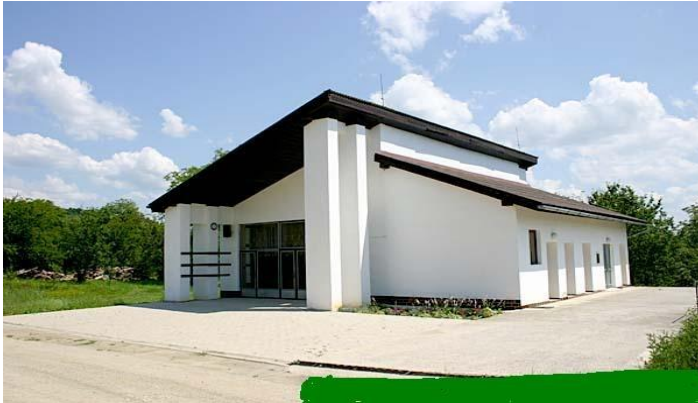
Dom smútku v obci Kružná

Stavba Domu smútku bola začatá v roku 1995. Dom smútku bol uvedený do prevádzky len v roku 1998. Kolaudácia stavby bola v roku 2009. Slávnostné odovzdanie Domu smútku do užívania sa uskutočnilo dňa 1. augusta 2009 pri príležitosti V. Dňa obce Kružná.