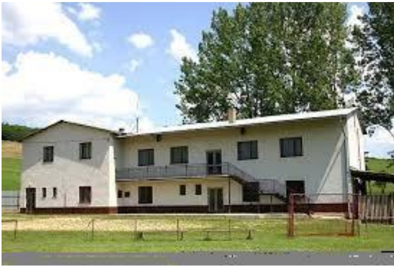
Kultúrny dom v obci Kružná

Kultúrny dom nájdete netradične na začiatku obce v areáli futbalového ihriska. Stavba kultúrneho domu bola začatá koncom 70-tych a začiatkom 80-tych rokov ešte za socializmu v rámci akcie Z – dobrovoľných brigádnických prác. Po vzniku samosprávy v 90-tych rokoch bola v rámci brigádnickej a v rámci verejnoprospešných prác dokončená. Kultúrny dom v Kružnej bol skolaudovaný v roku 2000 pri príležitosti I. Dňa obce.