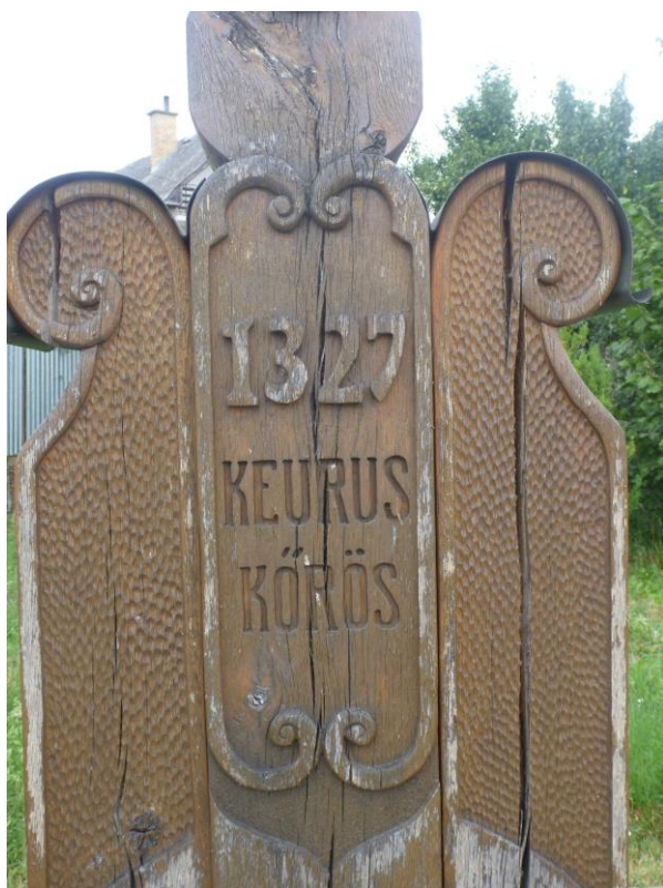
Pamätný stĺp v obci Kružná