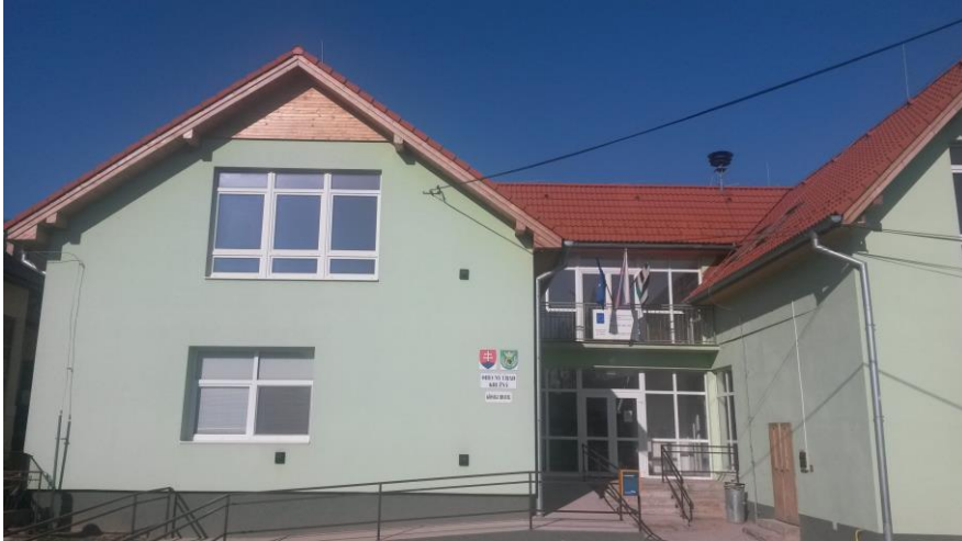
Obecný úrad v Kružnej

V súčasnosti v budove na prízemí sídli obecný úrad, a na poschodí je vytvorená remeselnícka izba a zariadená knižnica.