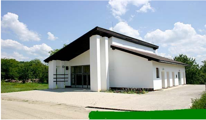
Dom smútku v obci Kružná

Stavba Domu smútku bola začatá v roku 1995. Dom smútku bol uvedený do prevádzky len v roku 1998. Kolaudácia stavby bola v roku 2009. Slávnostné odovzdanie Domu smútku do užívania sa uskutočnilo dňa 1. augusta 2009 pri príležitosti V. Dňa obce Kružná.